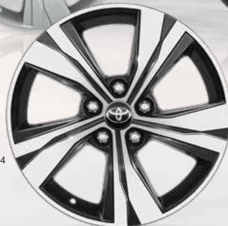
4. 17" sorte maskinbehandlede alufælg (5-eget) Option til alle udstyrsklasser