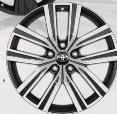
6. 18" sorte maskinbehandlede alufælg i højglans (5-dobbeltteget) Option til alle udstyrsklasser