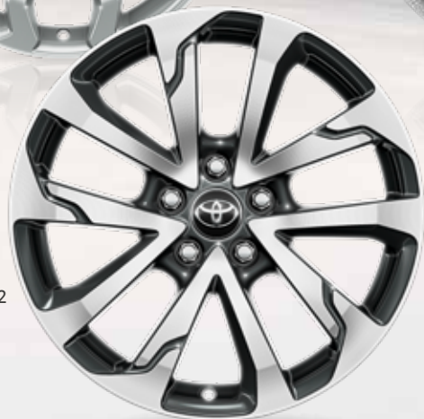
2. 18" mørkegrå maskinbehandlede alufælg (10-eget) Standard til Style og Elegant