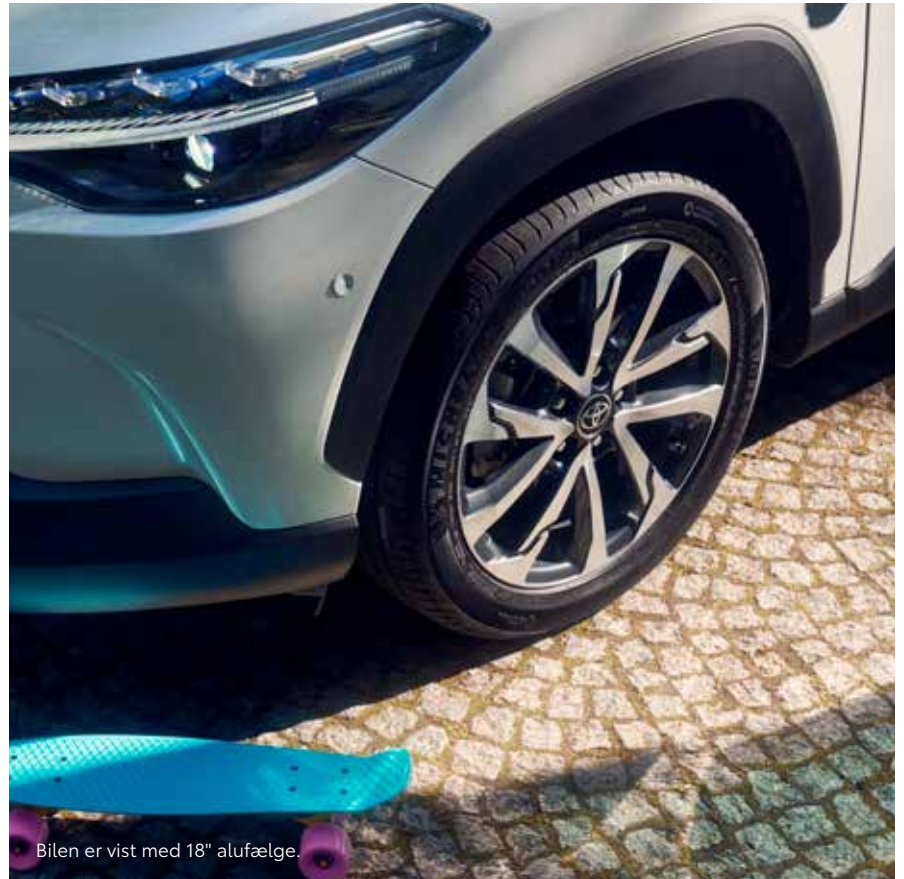
Bilen er vist med 18" alufælge.

Corolla Cross fås med sportslige og smarte alufælge, der matcher bilens kraftfulde fremtoning.