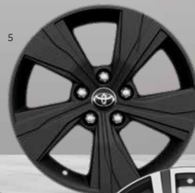
5. 17" matsorte alufælg (5-eget) Option til alle udstyrsklasser