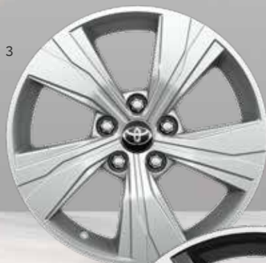
3. 17" sølvfarvede alufælg (5-eget) Option til alle udstyrsklasser