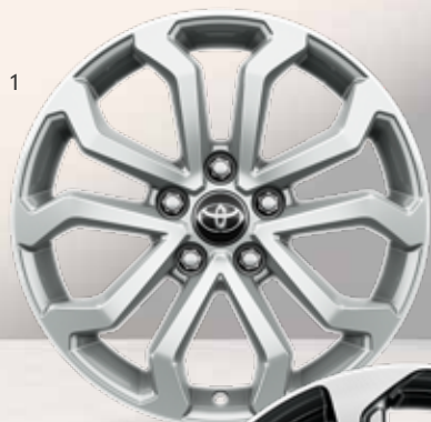
1. 17" sølvfarvede alufælg (5-dobbelt-eget) Standard til Active