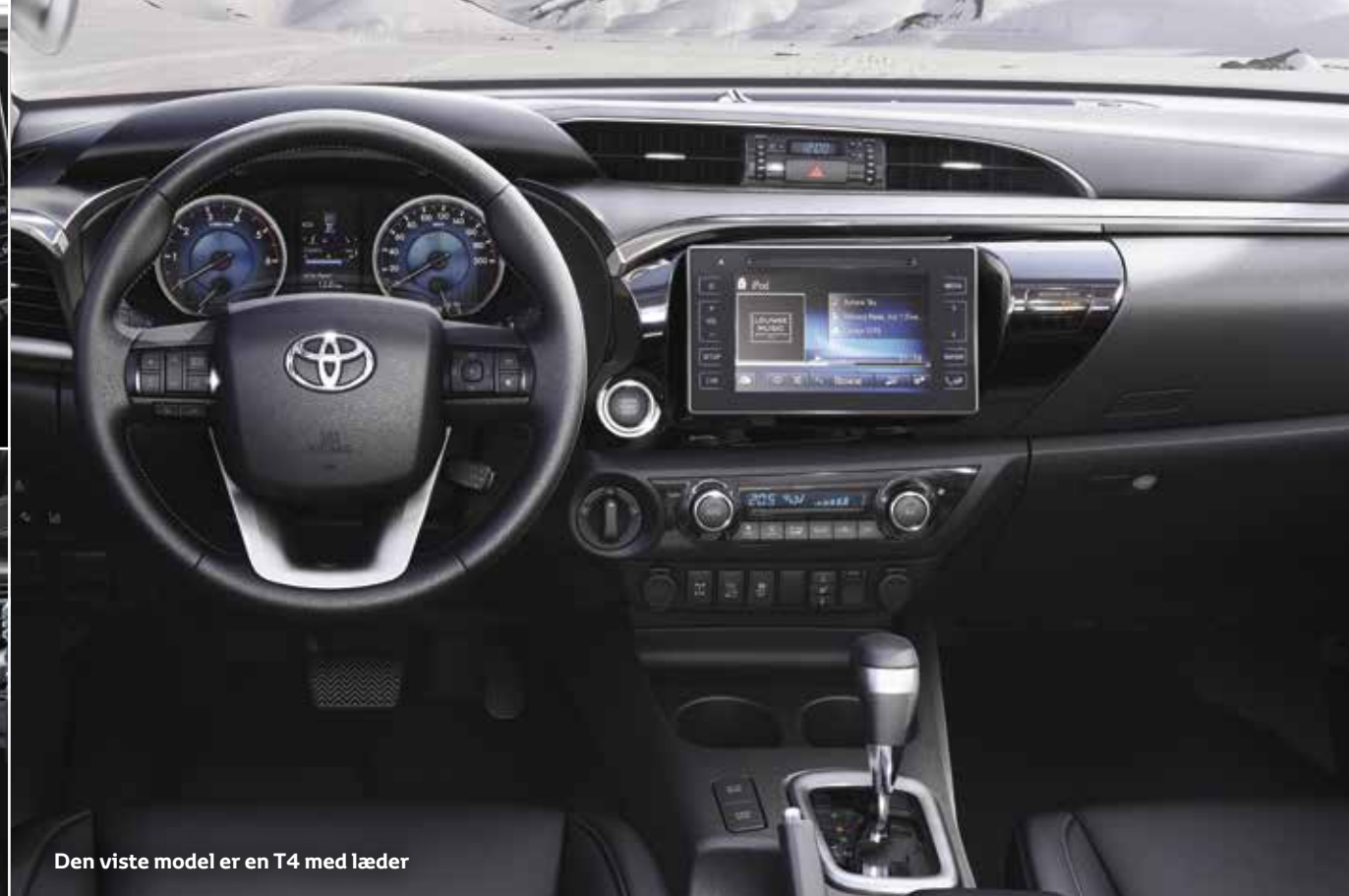
Den viste model er en T4 med læder