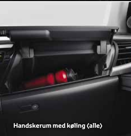
Handskerum med køling (alle)