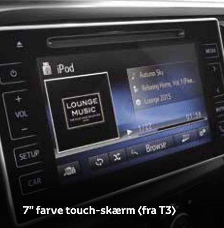
7" farve touch-skærm (fra T3)