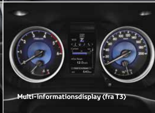
Multi-informationsdisplay (fra T3)