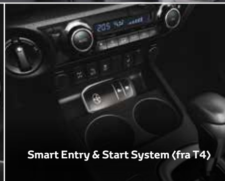
Smart Entry & Start System (fra T4)